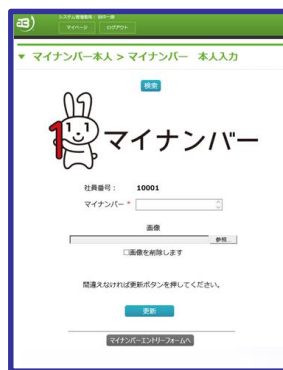
ATTACK BOARD WEB画面